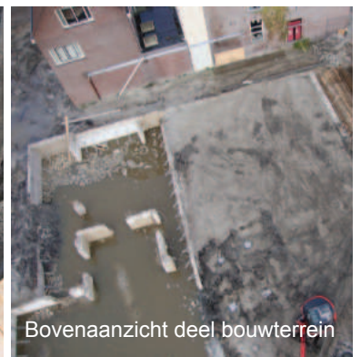
Bovenaanzicht deel bouwterrein